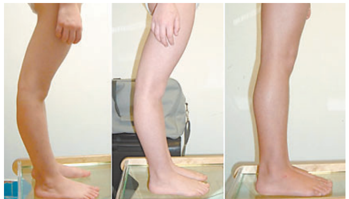
Aus Fehlstellungen an Gliedmaßen, der Wirbelsäule und der Kopfhaltung können Rückschlüsse auf die Krankheitsursache gezogen werden.

Für die Therapie haben die von Bernhard Bricot entwickelten Spezialsohlen zentrale Bedeutung. Der geniale Chirurg aus Marseille hat erkannt, dass im Gehirn eines jeden Menschen der Plan für seine Haltung abgespeichert ist. Mit Hilfe dieser Spezialsohlen kann man offensichtlich diesen Plan korrigieren. Bei regelmäßigen Kontrollen werden die notwendigen Feinabstimmungen der Behandlung vorgenommen und bei Bedarf auch Spezialisten aller Fachgebiete hinzugezogen, wichtige Erkenntnisse durch posturologische Behandlung oft Operationen vermeiden und auch schon aufgegebene Fälle können gute Lebensqualität zurückgewinnen.